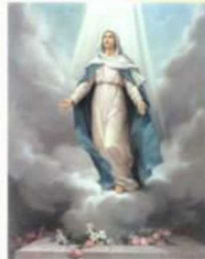
4. Успіння Пресвятої Богородиці- Ісус бере Богородицю до Неба

Хай не бентежиться серце ваше; віруйте в Бога, і в Мене віруйте. У домі Отця Мого місця багато. А якби не так, Я сказав би вам: Я йду приготувати місце вам. І коли піду і приготую вам місце, прийду знову і візьму вас до себе, щоб і ви були, де Я. А куди Я йду, ви знаєте, і шлях знаєте. Я є шлях і істина і життя; ніхто не приходить до Отця, як тільки через Мене. (Ін 14, 1-4.6b)