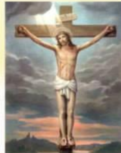
5. Розп'яття Ісуса Христа

24 Тоді розп'яли його й поділили його одягу, кинувши на неї жереб, хто що візьме. 25 Була ж: третя година, коли вони розп'яли його. 26 А був і напис, за що його засуджено, написаний: Цар Юдейський. (Мк 15:24-26) 44 Було вже близько шостої години, і темрява по всій землі настала аж до дев'ятої години, 45 бо затьмарилось сонце; а й завіса храму роздерлася посередині. 46 Ісус закликав сильним голосом: "Отче, у твої руки віддаю духа мого!" Сказавши це, він віддав духа. (Лк. 23:44-46)