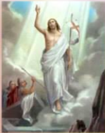
1. Воскресіння Ісуса Христа

5 Тоді ангел заговорив до жінок, кажучи: "Не бійтесь: знаю бо, що ви шукаєте Ісуса розіп'ятого. 6 Нема його тут, бо він воскрес, як ото сам прорік. Ходіть, гляньте на місце, де він лежав (Мт. 28:5-6)