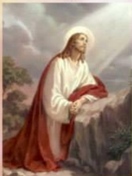
1. Молитва на Оливній горі

39 Тоді вийшов він і пішов, як звичайно, на Оливну гору. Слідом за ним пішли і його учні. 40 Яюке прибув на місце, він сказав їм: "Моліться, щоб не ввійти в спокусу." 41 І сам відійшов від них так, як кинути каменем і, ставши на коліна, почав молитися: 42 "Отче, коли ти хочеш, віддали від мене цю чашу, тільки хай не моя, а твоя буде воля!" 43 Тоді з'явився йому ангел з неба, що підкріплював його. 44 Повний скорботи та тривоги, ще пильніш молився, а піт його став, мов каплі крові, що падали на землю. 45 Підвівшись від молитви, він підійшов до учнів і застав їх сплячими від смутку. (Лк 22: 39-45).