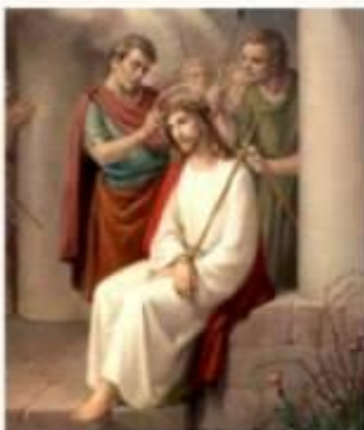
3. Коронування Ісуса терновим вінком

2 А вояки, сплівши вінки із тернини, вклали йому на голову ще й зодягли його у багрянцю 3 і, підступаючи до нього, казали: «Радуйся, царю юдейський!» І били його в обличчя. (Ів. 19:2-3)