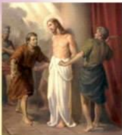
2. Бичування Ісуса

1 Забрав тоді Пилат Ісуса та й звелів його бичувати. (Ів 19,1). 5 Він же був поранений за гріхи наші, роздавлений за беззаконня наші. Кара, що нас спасає, була на ньому, і його ранами ми вилікувані. (Іс. 53:5).