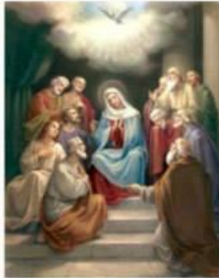
3. Зіслання Святого Духа

1 А як настав день П'ятидесятниці, всі вони були вкупі на тім самім місці. 2 Аж ось роздався з неба шум, неначе подув буйного вітру, і сповнив увесь дім, де вони сиділи. 3 І з'явилися їм поділені язики, мов вогонь, і осів на кожному з них. 4 Усі вони сповнились Святим Духом і почали говорити іншими мовами, як Дух давав їм промовляти. (Діяння 2:1-4)