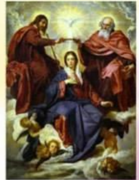
5. Прослава Марії в Небі

Заспіваємо Давидову пісню, вірні, дівственні Невісті, Матері всіх Царя Христа! "Праворуч Тебе Владико, стоїть Цариця зодягнена в золоту тканину і оздоблена божественною красою." (Пс. 44:10) 1 І знамення велике видно було на небі - жінка, одягнена в сонце, і місяць під стопами її, а на голові її вінець із дванадцяти зірок. (Откр 12,1).