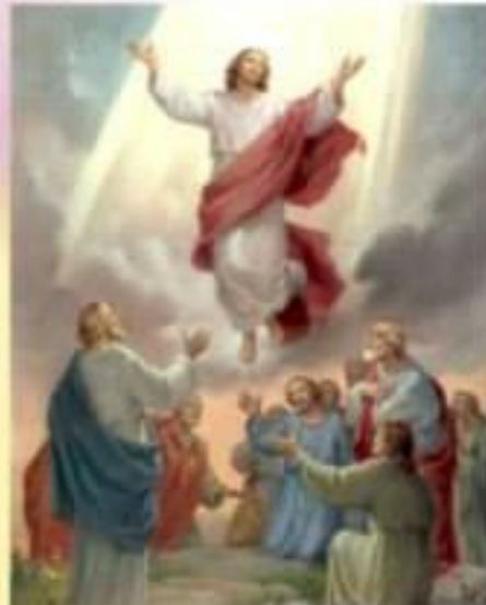
2. Вознесіння Ісуса Христа

50 І він вивів їх аж до Витанії і, знявши руки свої, благословив їх. 51 А як він благословляв їх, віддалився від них і почав возноситись на небо. 52 Вони ж, поклонившись йому, повернулися з радістю великою в Єрусалим, 53 і перебували весь час у храмі, славлячи та хвалячи Бога. (Лк. 24:50-53)