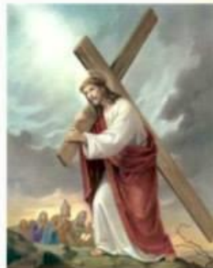
4. Хресна дорога Ісуса

17 І забрали вони Ісуса; і, несучи для себе хрест, вийшов він на місце, зване Череп, а по-єврейськи Голгота, (Ів. 19:17)